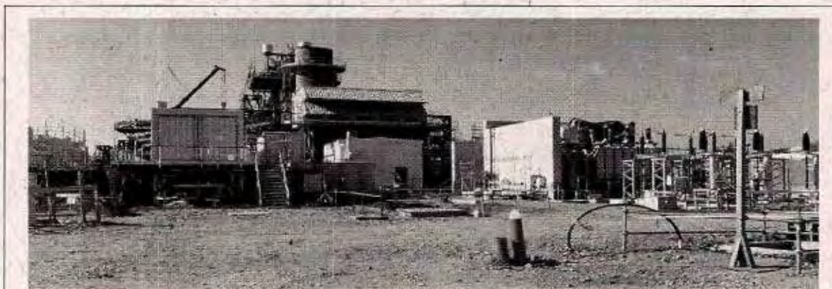
Fotografía N° 1, vista panorámica de la Cogeneradora Aconcagua.

Material fotográfico de la visita a terreno a la Cogeneradora Aconcagua.