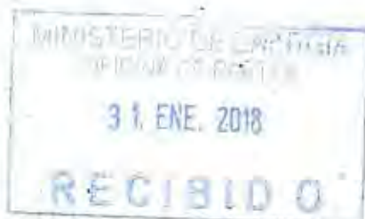
DOROTHY PEREZ GUTIERREZ Contralora General de la República (S)