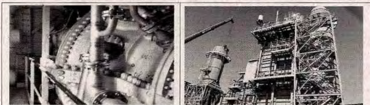
Fotografías N°s 2 y 3, Turbina de gas natural con su generador eléctrico.